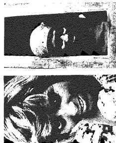
Carolína de Jesus. O ponto final.